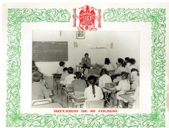
Tiagua 1961