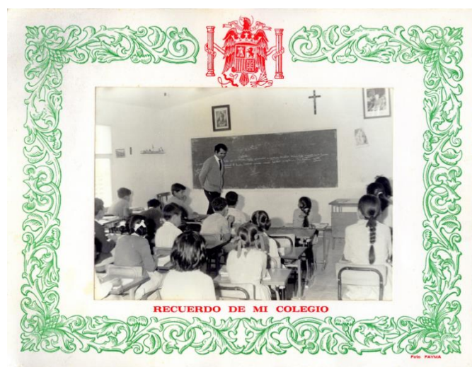
Tiagua 1961