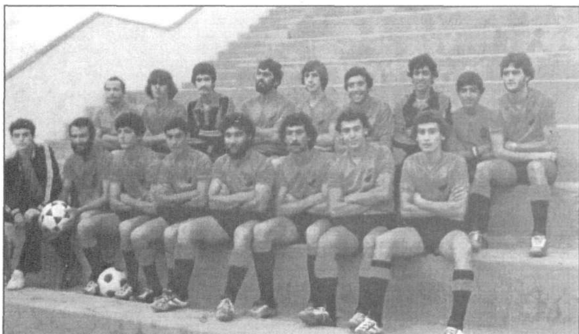
Orientación Marítima (1981 / 82).