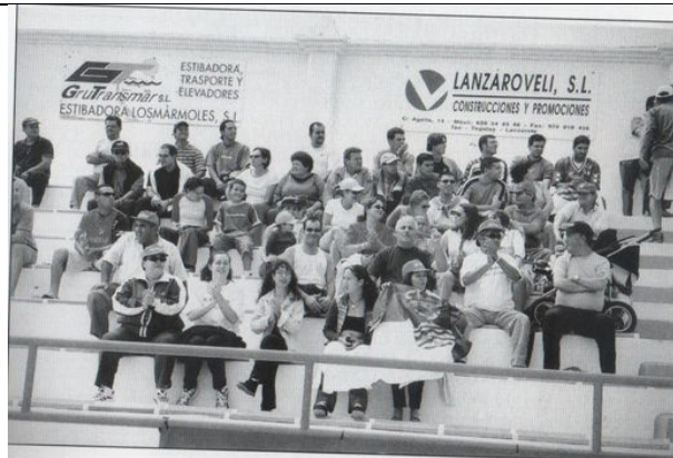
Una afición que siempre ha demostrado un gran cariño por los colores del equipo de su municipio.