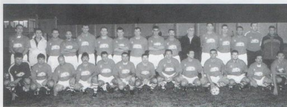
Equipos del F.C. Barcelona, U.D. Las Palmas y C.D. Teguise que participaron en la inauguración del césped artificial del campo de «Los Molinos».