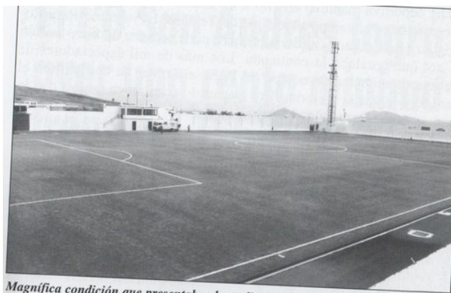
Magnífica condición que presentaba el estadio de «Los Molinos» de Teguiise para el partido decisivo del ascenso a la Tercera División.

La promoción para el ascenso a la Tercera División entre los subcampeones de las provincias de Las Palmas y Tenerife, el C.D. Te-guiise y el San Andrés, se disputó primero en el campo del equipo tinerfeño.