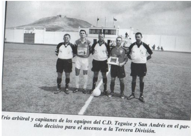
Trío arbitral y capitanes de los equipos del C.D. Tegui se y San Andrés en el partido decisivo para el ascenso a la Tercera División.

Con esta inauguración el C.D. Tegui se adapta a las nuevas exigencias en materia deportiva y del reglamento deportivo para poder disputar partidos de mayor envergadura en su campo de juego. A partir de la instalación de este césped sintético, la capacitación y entrenamiento deportivo de los jugadores que juegan en este campo, tanto jóvenes como mayores, redundará en un mayor rendimiento deportivo del club de la Villa.