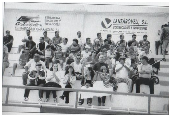
Una afición que siempre ha demostrado un gran cariño por los colores del equipo de su municipio.